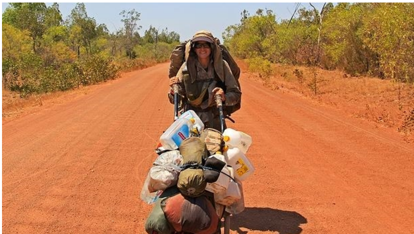
Marquis casi al final de su periplo - ABC